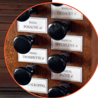
Neue Registerzüge und Manubrien

Wir laden Sie herzlich ein, die Schönheit dieser besonderen Orgel im Gottesdienst oder im Konzert zu genießen!