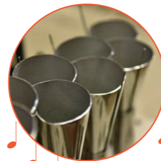
Neue Zungenregister im Hauptwerk